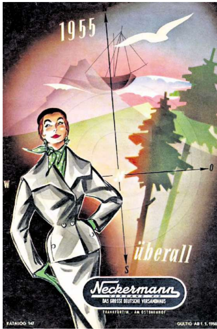
Neckermann-Katalog aus dem Jahr 1955: Heute lebt das traditionsreiche Versandhaus vor allem von Online-Shopping.

Sein Versandhaus hat die Ausgaben, unterstützt von der Düsseldorfer Strategieberatung SMP, zuletzt drastisch reduziert. Nicht mehr benötigte Büroflächen gingen an neue Mieter, den teuren Außendienst stellte Neckermann ein, und auch